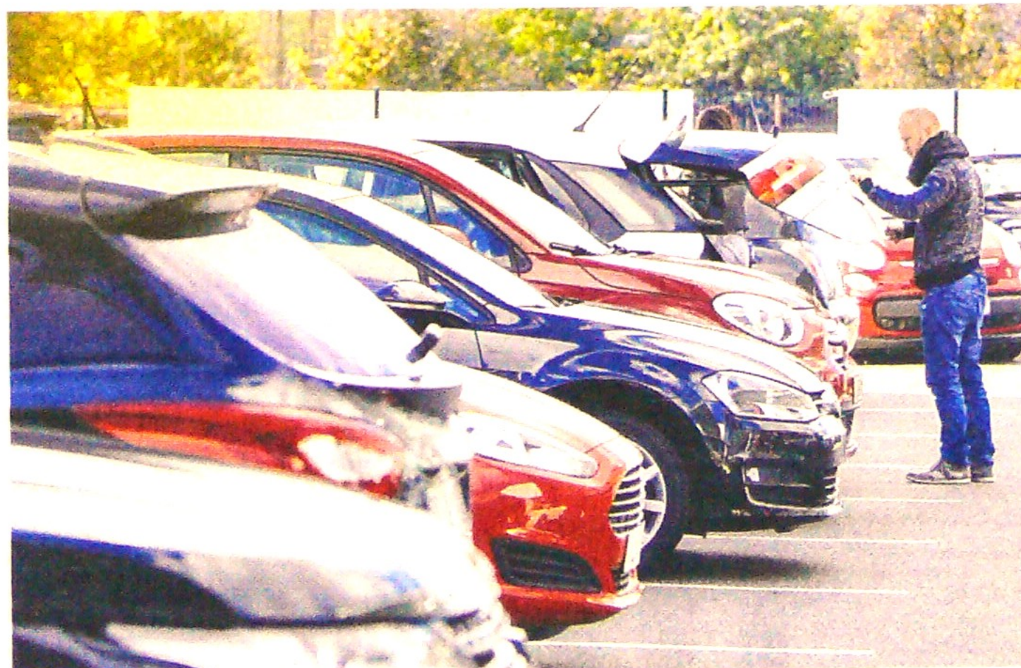
La comercialización de vehículos eléctricos e híbridos ha tenido un incremento importante.