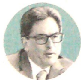
ALBERTO CARRASQUILLA Ministro de Hacienda

“Hicimos unos cálculos de qué le costaría al país una declaratoria de inconstitucionalidad de la Ley de Financiamiento y dividi-