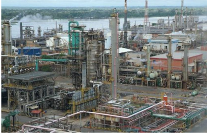
Refinería de Ecopetrol en Barrancabermeja

El presidente de la Agencia Nacional de Hidrocarburos (ANH), Luis Miguel Morelli, anunció que la entidad está en conversaciones con Ecopetrol con el fin de que la petrolera devuelva 15 campos pequeños que actualmente están inactivos por la baja rentabilidad económica que estos generan a la compañía.