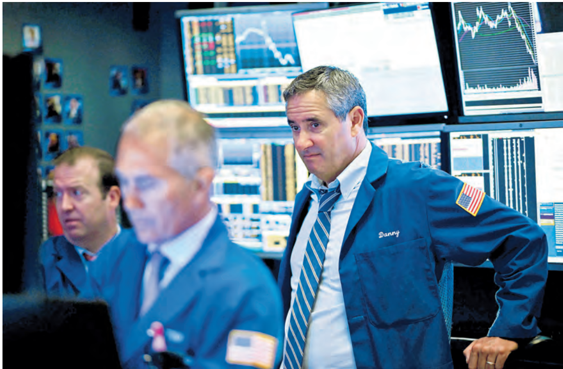
El Dow Jones tuvo una caída de 1,88%. En los últimos dos días el índice bajó 800 unidades.

Cerca de 20 iniciativas de impacto social, que tendrían fines electorales y no cuentan con financiación ni estudios sobre sus efectos, hacen fila en el Legislativo. Pág. 8