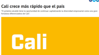
El Cali crece más rápido que el país.

“El próximo alcalde tiene la oportunidad de continuar capitalizando la diversidad empresarial como una gran fortaleza diferenciadora de Cali”.