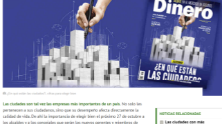
El "¿En qué están las ciudades?", cifras para elegir bien.

En pocos días habrá nuevos alcaldes. Dinero hace una radiografía del estado actual de las ocho principales capitales del país y sus retos a futuro.