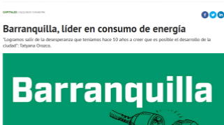
El Barranquilla, líder en consumo de energía.

“Logramos salir de la desesperanza que teníamos hace 10 años a creer que es posible el desarrollo de la ciudad”: Tatiana Orozco.