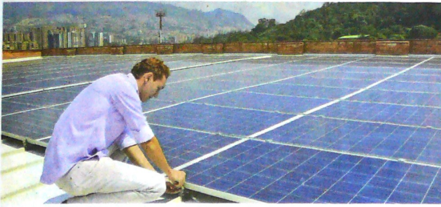
En la Institución Universitaria Salazar y Herrera de Medellín, 356 paneles solares de autoabastecimiento.