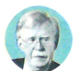
Fernando Carrillo, procurador general.

En su primera intervención pública tras ser despedido, dijo que Corea del Norte no ha tomado la decisión estratégica de abandonar las armas nucleares.