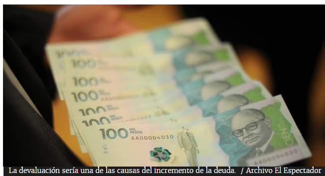
La devaluación sería una de las causas del incremento de la deuda.

El saldo de la deuda pública como porcentaje del Producto Interno Bruto (PIB) incrementó en 2018, pues alcanzó el 59 % mientras que en 2017 había sido de 56,6 %.