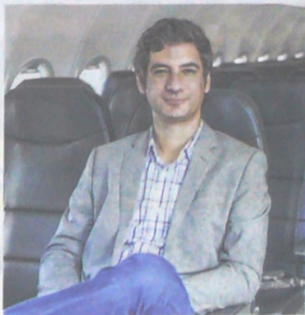
Líder. El argentino Félix Antelo Abud es el presidente del Grupo Viva Air. En el país completó año y medio de labores.

costo ha seguido evolucionando y ha entrado en Colombia con éxito. Nosotros, por ejemplo, tenemos hoy una participación de mercado del 15%, lo cual muestra que el modelo sea más entendido y aceptado.