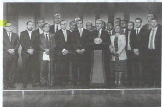
El Presidente Iván Duque anunció la serie de propuestas de alcance social en el proyecto de Ley de Crecimiento Económico, luego de la reunión con los ponentes de las comisiones terceras de Senado y Cámara.