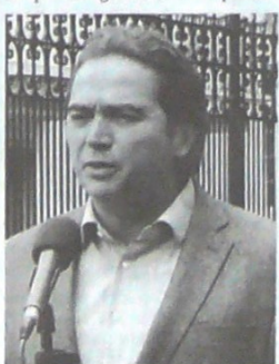
Juan Alberto Londoño Martínez, viceministro general de Hacienda.

"Los pensionados en Colombia van a tener a través de esta Ley de Crecimiento Económico el cumplimiento de un sueño, y es la reducción del aporte a salud, que empezará el año entrante con la reducción del 12% al 8%, seguirá en el 8% y llegará al 4% en el 2022. Es un proceso gradual, es un proceso