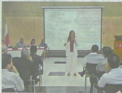
Aspecto de la socialización con autoridades y gremios.

“Es muy importante la actitud que tenga la costa Caribe frente a este proceso. Si los interesados ven que hay una oportunidad de inversión, trabajando de manera conjunta con los gobiernos locales, habrá mayores oportunidades de éxito”, expresó.