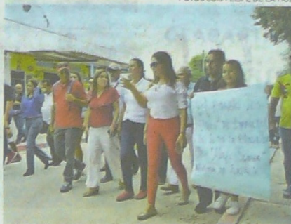
La ministra durante su recorrido en Los Olivos I.

Asimismo, aclaró que durante la subasta hay tres posibilidades, un operador para todo el mercado de la región, o se divida en dos el mercado.