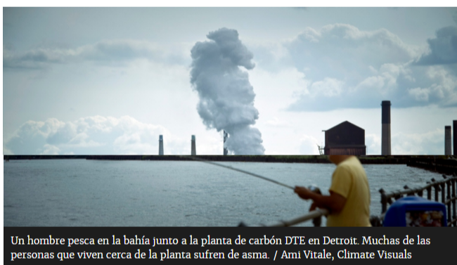
Un hombre pesca en la bahía junto a la planta de carbón DTE en Detroit. Muchas de las personas que viven cerca de la planta sufren de asma.

Para 2030, la explotación de estos recursos superará en 50 % la cantidad necesaria para limitar el calentamiento global a 2 ° C, según un informe de Naciones Unidas.