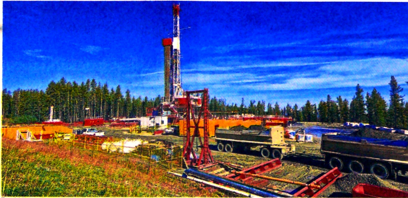
En el Midland, cuenca Permian, en Texas (EE. UU.), Ecopetrol adicionará a sus reservas cerca de 160 millones de barriles.

Hace menos de un mes, la petrolera colombiana sus-