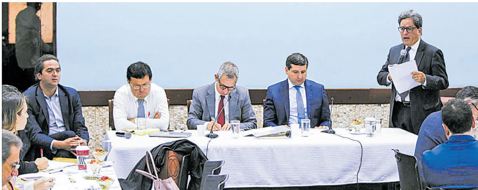
En cabeza del ministro de Hacienda, Alberto Carrasquilla, (der.) hoy continuarán las reuniones para afinar la ponencia con los parlamentarios.

La reforma tributaria tendría por los menos 12 cambios, según acordaron ayer el Minhacienda y los ponentes del proyecto. Habría otro año de amnistía fiscal y se revisaría el Impoconsumo para los inmuebles de más de $918 millones. Pág.8