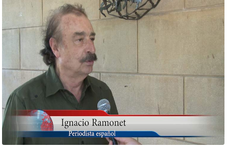
Ignacio Ramonet Periodista español