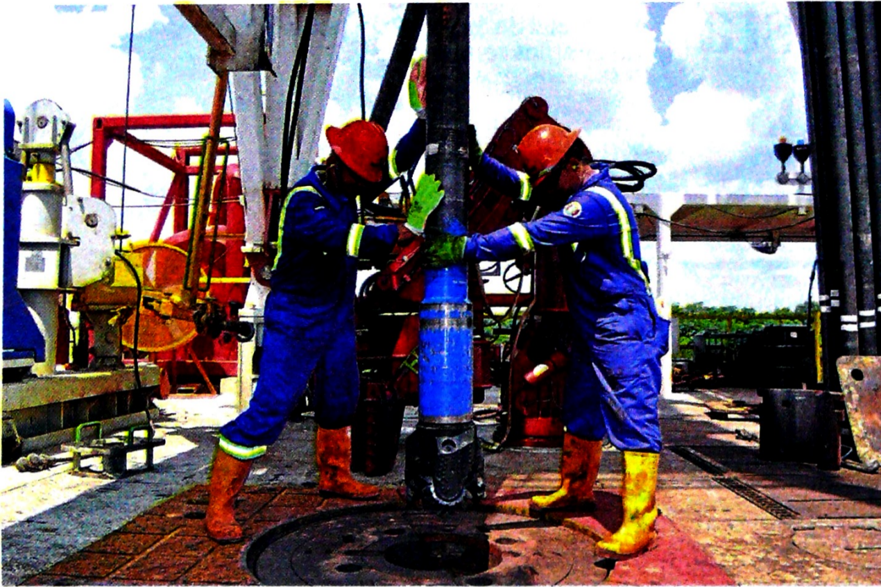
La Agencia Nacional de Hidrocarburos hará la promoción en tres naciones de Europa, cinco de Asia y cuatro de América.