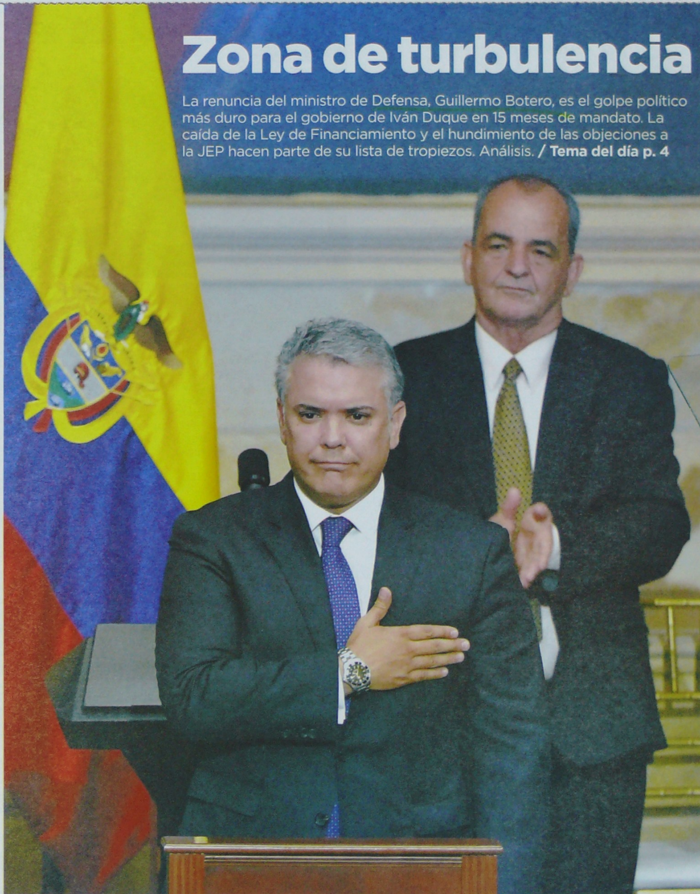
El presidente Iván Duque enfrenta la coyuntura política más difícil de su mandato, hasta ahora, y deberá recomponer su relación con el Congreso.

La renuncia del ministro de Defensa, Guillermo Botero, es el golpe político más duro para el gobierno de Iván Duque en 15 meses de mandato. La caída de la Ley de Financiamiento y el hundimiento de las objeciones a la JEP hacen parte de su lista de tropiezos. Análisis. / Tema del día p. 4