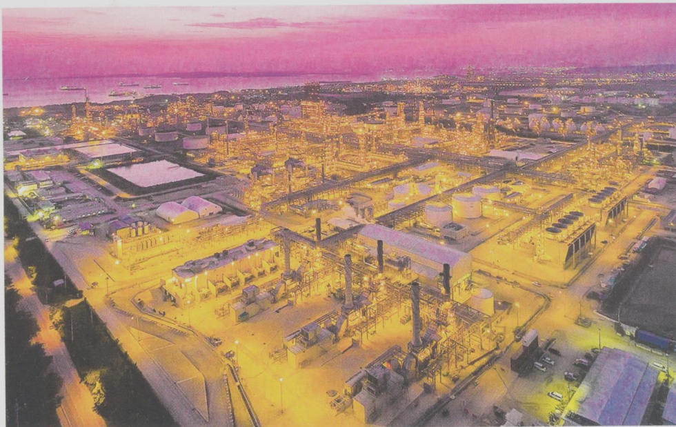
La Refinería de Cartagena (Reficar) es la empresa más exportadora e importadora del departamento.

Estados Unidos, Puerto Rico, Brasil, India, Ecuador, México, Perú y Panamá son los principales mercados de los productos