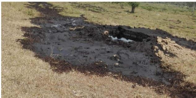
El oleoducto fue dinamitado en el sector de Saravena.

RELACIONADOS: ARAUCA | MILITARES | GUERRILLA