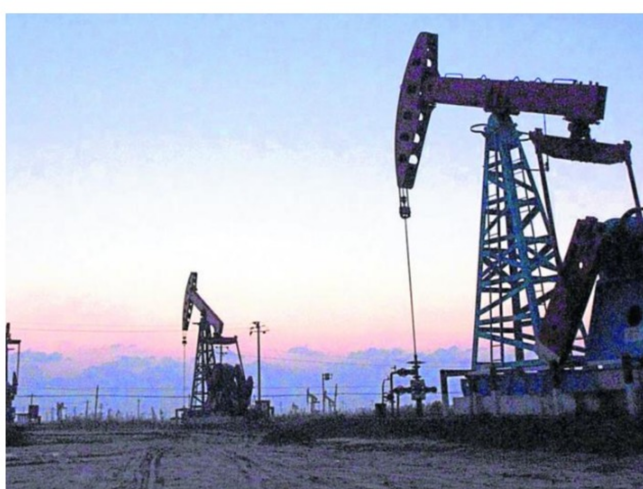
Los compradores tradicionales de petróleo venezolano están buscando alternativas.