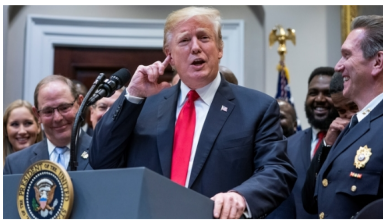
El presidente de los Estados Unidos, Donald J. Trump.

30 marzo, 2019 | Julián Medina | América del Norte, Estados Unidos, Internacional, Medio Ambiente