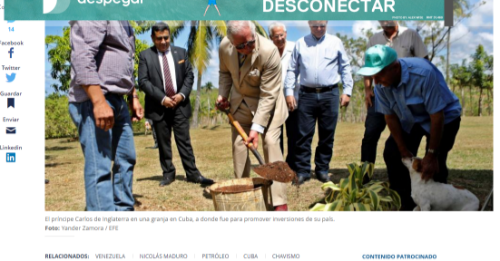
El príncipe Carlos de Inglaterra en una granja en Cuba, a donde fue para promover inversiones de su país.

La isla busca afanosamente mayor inversión extranjera, pero Washington no se lo facilita.