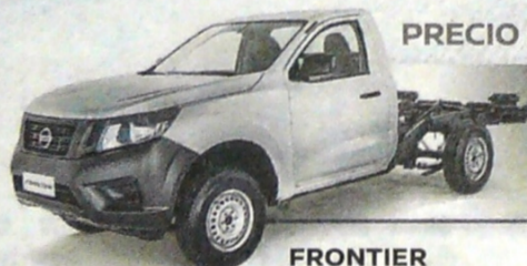
FRONTIER CHASIS 4X2