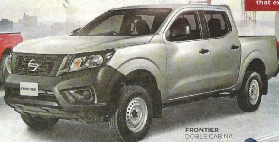
FRONTIER DOBLE CABINA