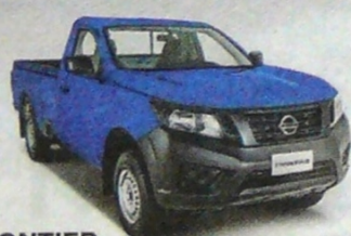
FRONTIER CABINA SENCILLA