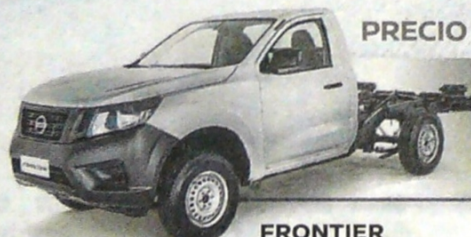
FRONTIER CHASIS 4X2