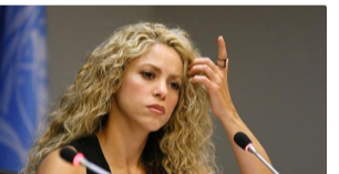
Shaki Revela su Secreto Sobre sus Ingresos