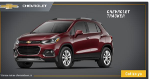
La Chevrolet Tracker de esta foto puede ser tuya.