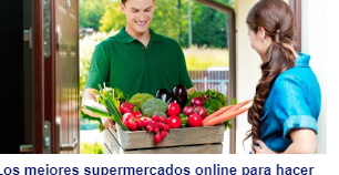
Los mejores supermercados online para hacer la compra