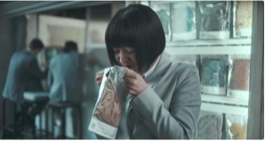
Asiáticas olisqueando ropa sudada: así es el anuncio que escandaliza a Corea por racista