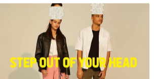
La "casi historia de amor" con la que todo el mundo se está sintiendo identificado