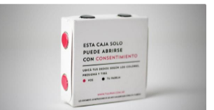
De a dos. Lanzaron un pack de preservativos que solo se abre si hay consentimiento