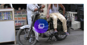
Las ciudades más baratas para vivir en 2019