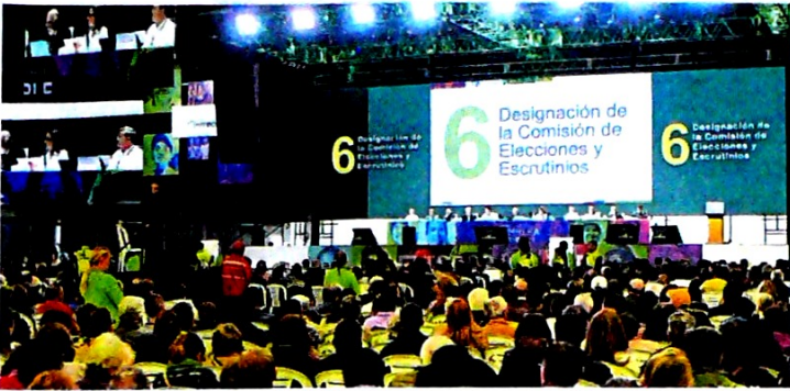
En la asamblea, el presidente de Ecopetrol, Felipe Bayón, destacó que se siguen evaluando oportunidades de inversión en todo el continente.

Asamblea aprobó repartir dividendos por $ 9,2 billones. Buscan bajar más las cuotas de manejo que pagan estos inversionistas.