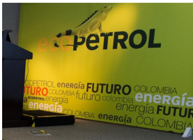
BLU Radio. Ecopetrol / Foto: AFP.

La empresa tiene cerca de 300.000 accionistas de los cuales unos 3.400 se hicieron presentes en Corferias para participar de la asamblea anual.