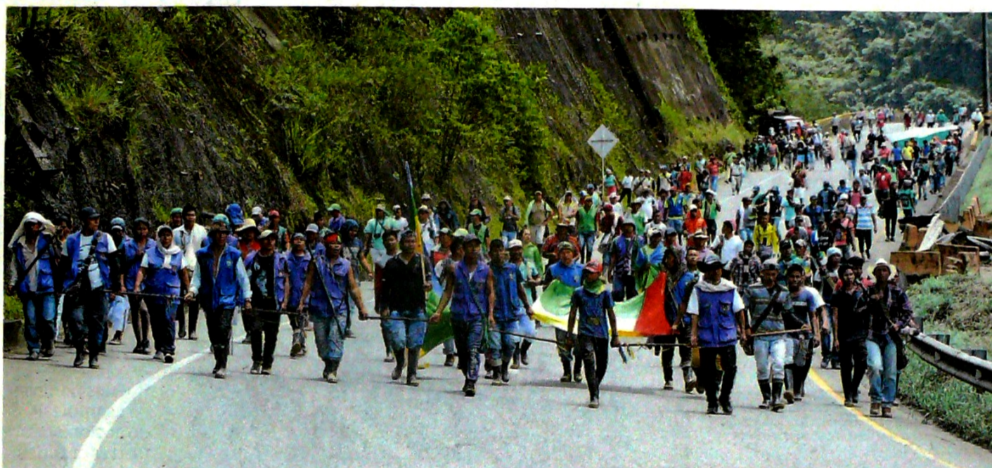
Esta semana, indígenas del cabildo de Juntas, en el Valle, marcharon por la vía al mar desde Cisneros hasta el corregimiento La Delfina, en Buenaventura.

POPAYÁN, NEIVA, CÚCUTA Y PASTO | @ColombiaET