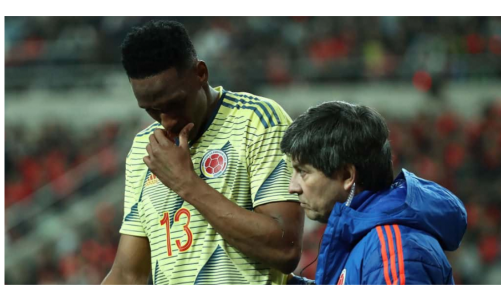
Yerry Mina

"Yerry Mina corre el riesgo de no jugar la Copa América por problemas en el bíceps femoral de su pierna izquierda. En principio la incapacidad estaría entre 6 y 8 semanas", trino el comunicador.