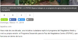
Mujeres trabajan en un programa de agroecología promovido por el programa.

Hace más de una década, una iniciativa ciudadana replicó el programa del Magdalena Medio y creó su propia versión: el Programa Desarrollo para la Paz del Magdalena Centro (PDPMC), que funciona sin ánimo de lucro.