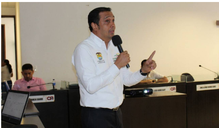
Asamblea de Bolívar

Impuesto de cerveza, participación a consumo de licores y cigarrillos, fueron los conceptos que la Gobernación recibió más dinero en 2018