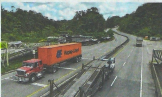
Doble calzada al mar. Aún faltan alrededor de 34 kilómetros de construcción de la vía para completar la doble calzada, de los cuales 17 son los más complejos.

De igual manera, se contempla la construcción de una nueva calzada entre Calarcá (en el Quindío) y La Pailla (en el Valle), obras que demandarán