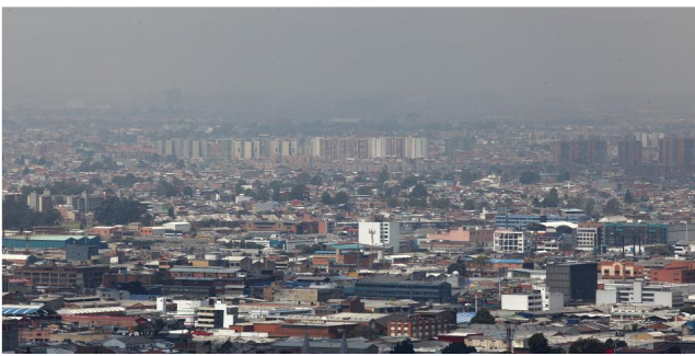
Es la segunda vez en el año que las autoridades declaran la emergencia ambiental por calidad del aire.

RELACIONADOS: BOGOTÁ | CONTAMINACIÓN AMBIENTAL | CALIDAD DEL AIRE