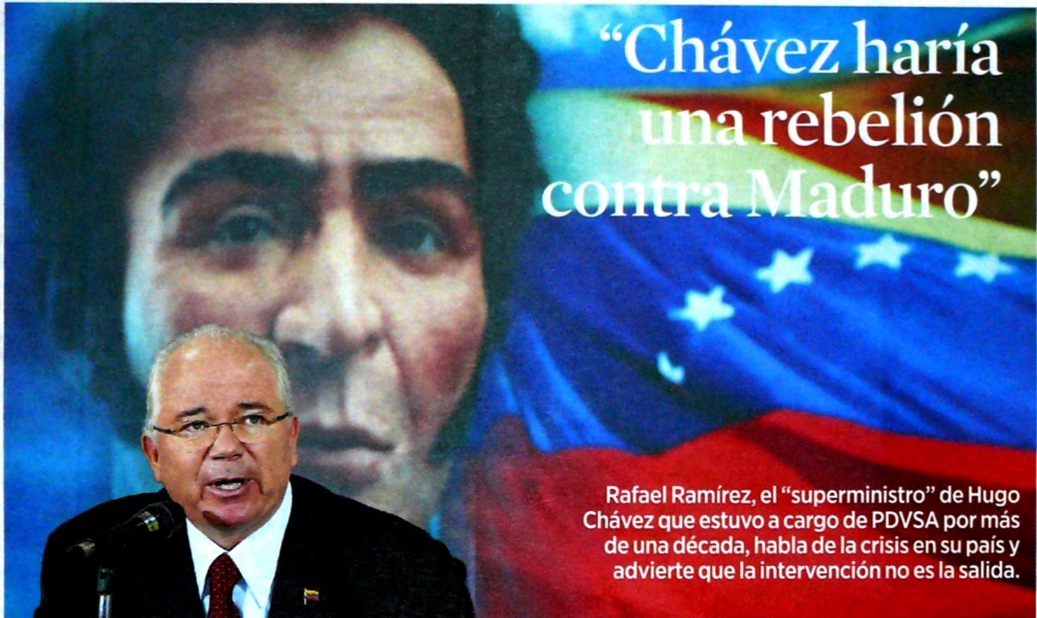
Rafael Ramírez fue director de la empresa de Petróleos de Venezuela (PDVSA) de 2004 a 2014. Se le consideró el “superministro” de confianza de Chávez.

Rafael Ramírez, el “superministro” de Hugo Chávez que estuvo a cargo de PDVSA por más de una década, habla de la crisis en su país y advierte que la intervención no es la salida.