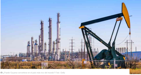
¿Puede Guyana convertirse en el país más rico del mundo?

ExxonMobil dice haber descubierto una reserva equivalente a más de 5.500 millones de barriles de petróleo bajo las aguas de Guyana. Será el petróleo una maldición o una oportunidad para el país más pobre de la región.