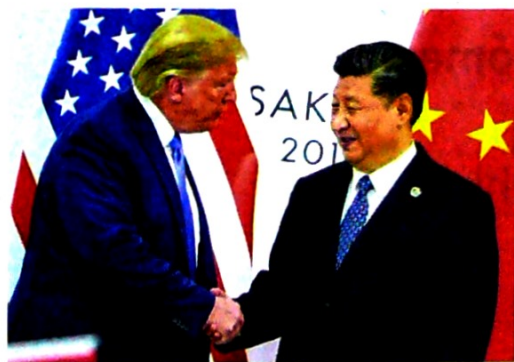
Trump y Xi se reunieron en Japón, durante la cumbre del G20.

Las medidas de EE. UU. contra Huawei centraron buena parte de la negociación, puesto que