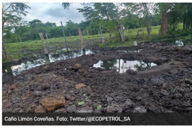
Caño Limón Coveñas.

El año pasado se registraron 107 atentados en la infraestructura petrolera colombiana.