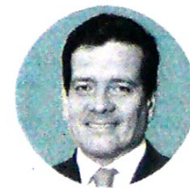
FELIPE BAYÓN PARDO Presidente de Ecopetrol

Cabe recordar que Felipe Bayón Pardo, presidente de la petrolera, señaló al cierre del ejercicio financiero del primer trimestre que la refinería de Cartagena continuó con su proceso de optimización, logrando una carga de 155.000 barriles por día, 7% más que en el primer trimestre de 2018, como resultado de una operación estable y la imple-