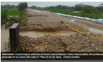
Sanciones: Corporinoquia adelanta procesos sancionatorios contra responsables del problema generado en la cuenca del Caño El Plato en la vía Tame - Puerto Rondón.

En su función de control y seguimiento la Territorial de Corporinoquia acogió la reunión de la Unidad de Gestión de Riesgo Departamental y representantes del sector del caño El Plato en la vía que de Tame conduce a Puerto Rondón, para socializar las acciones que adelanta la Gobernación de Arauca en la afectación que se viene generando sobre este afluente.