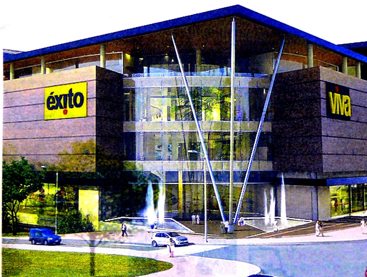
La operación de la cadena colombiana tiene un peso importante en los negocios de Casino.

Como parte del ajuste en la región, el conglomerado francés plantea que su filial brasileña Grupo Pão de Açúcar (GPA) lance una oferta pública para adquirir la totalidad de las acciones de Almacenes Éxito. Pág. 4