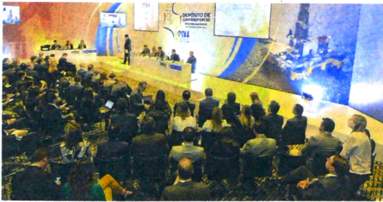
En los próximos días comenzará el proceso para la firma de los 10 contratos.