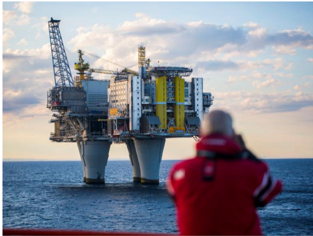
Las reservas de crudo de Estados Unidos cayeron en 7,5 millones de barriles.