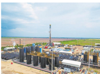
La petrolera tiene como meta estratégica desarrollar de manera más eficiente el bloque Llanos 34 (foto) en el 2019.