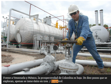
Frente a Venezuela y México, la prospectividad de Colombia es baja. De diez pozos que se exploran, apenas se tiene éxito en tres. / Ecopetrol .

La Agencia Nacional de Hidrocarburos espera firmar 11 contratos petroleros la próxima semana con inversiones superiores a los US$500 millones.