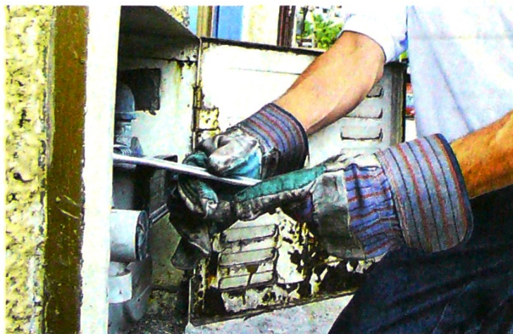
Se han detectado alteraciones en contadores hechas por bandas organizadas.

Y agrega que recientemente, en mayo, en el congreso anual de la Asociación Colombiana de Ingeniería Sanitaria y Ambiental (Acodal), la empresa de acueducto de Pasto, también emitió una alerta por situaciones de fraude.