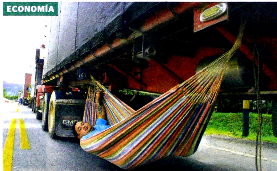
Los peajes de las carreteras alternativas tendrán una rebaja del 50% mientras dure la emergencia.