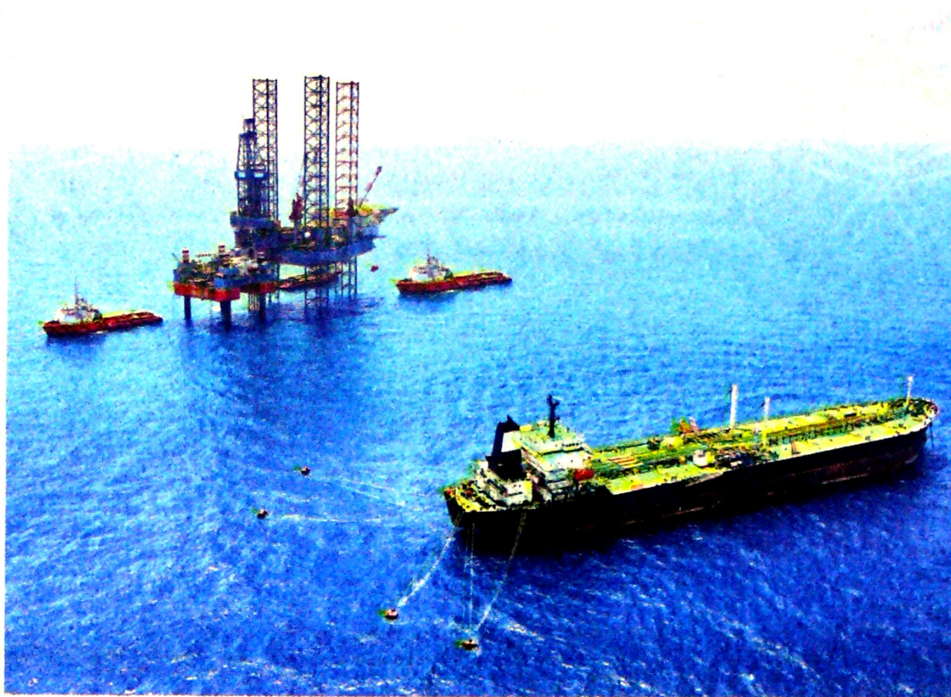
En mayo del 2017, en el bloque Purple Angel, se realizaron descubrimientos de gas de Kronos, Gorgon y Purple Angel.

En este último, las fuentes de la petrolera colombiana le indicaron a Portafolio que la devolución esta siendo objeto de estudio para su aprobación por parte de la Autoridad Nacional de Licencia Ambientales (Anla), y que es la entidad la que, en últimas, otorga el aval.