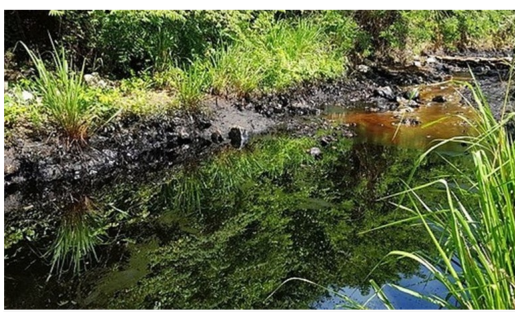
Imagen de referencia.

La estatal activó plan de contingencia para poder atender la emergencia causada por el atentado.