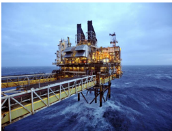
En mayo del 2017, en el bloque Purple Angel, se realizaron descubrimientos de gas de Kronos, Gorgon y Purple Angel. (Sto)

POR: PORTAFOLIO - JUNIO 25 DE 2019 - 10:02 P.M.