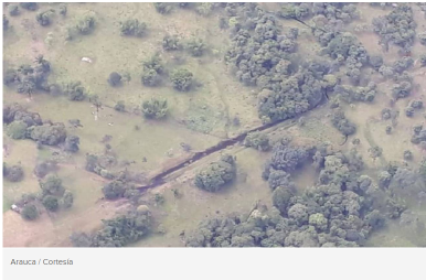
Arauca / Cortesía

La acción terrorista se registró en la vereda La Pava, zona rural del municipio de Saravena donde hubo derrame de crudo, confirmó la estatal petrolera