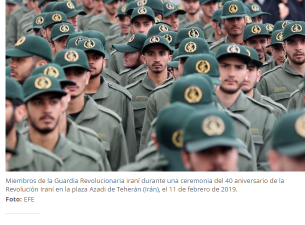
Miembros de la Guardia Revolucionaria iraní durante una ceremonia del 40 aniversario de la Revolución iraní en la plaza Azadi de Teherán (Irán), el 11 de febrero de 2019.