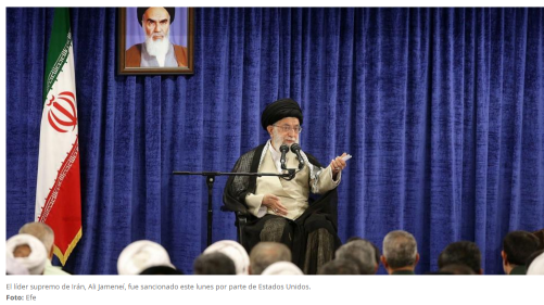
El líder supremo de Irán, Alí Jameneí, fue sancionado este lunes por parte de Estados Unidos.