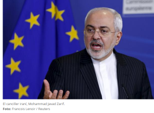
El canciller iraní, Mohammad Javad Zarif.

Su secretario de Tesoro, Steven Mnuchin, precisó que las sanciones congelarían "miles de millones de dólares en activos" iraníes. También anunció sanciones contra el jefe de la diplomacia del país, Mohamed Mohamed Javad Zarif, quien dirigió las negociaciones nucleares con las principales potencias.