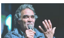
Sergio Fajardo explica por qué votara en blanco